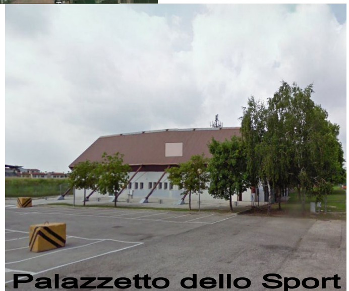
Palazzetto dello Sport

FEDERAZIONE ITALIANA di ATLETICA LEGGERA Comitato Provinciale Venezia www.fidalvenezia.it – cp.venezia@fidal.it