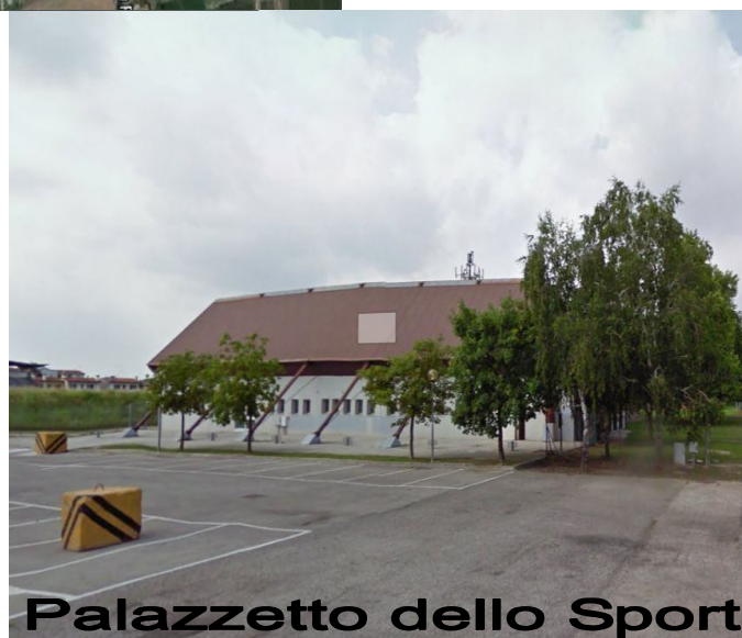
Palazzetto dello Sport

FEDERAZIONE ITALIANA di ATLETICA LEGGERA Comitato Provinciale Venezia www.fidalvenezia.it – cp.venezia@fidal.it